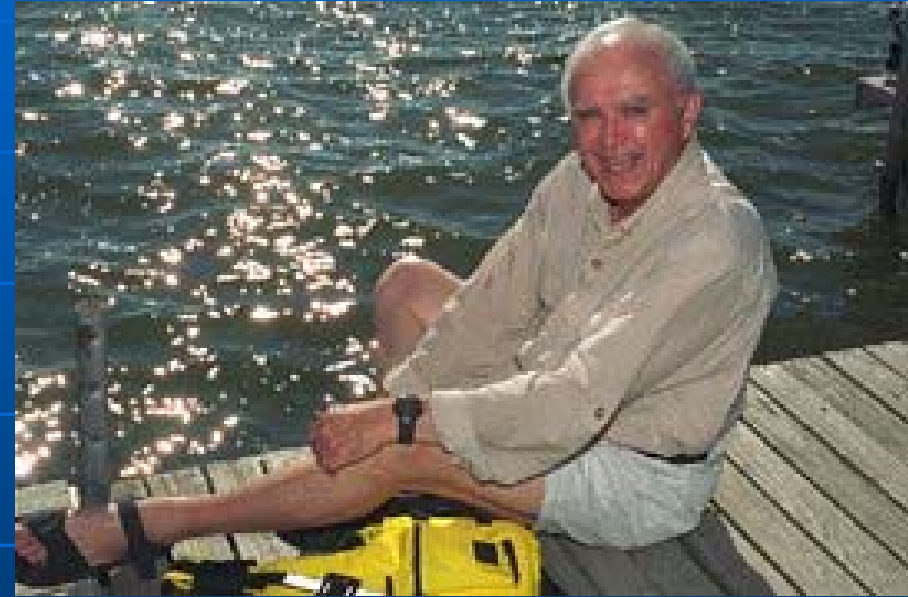
Вспышка высветила объект