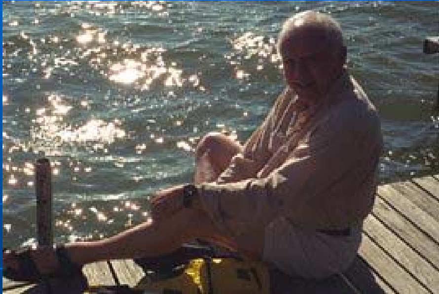
Тени на лице