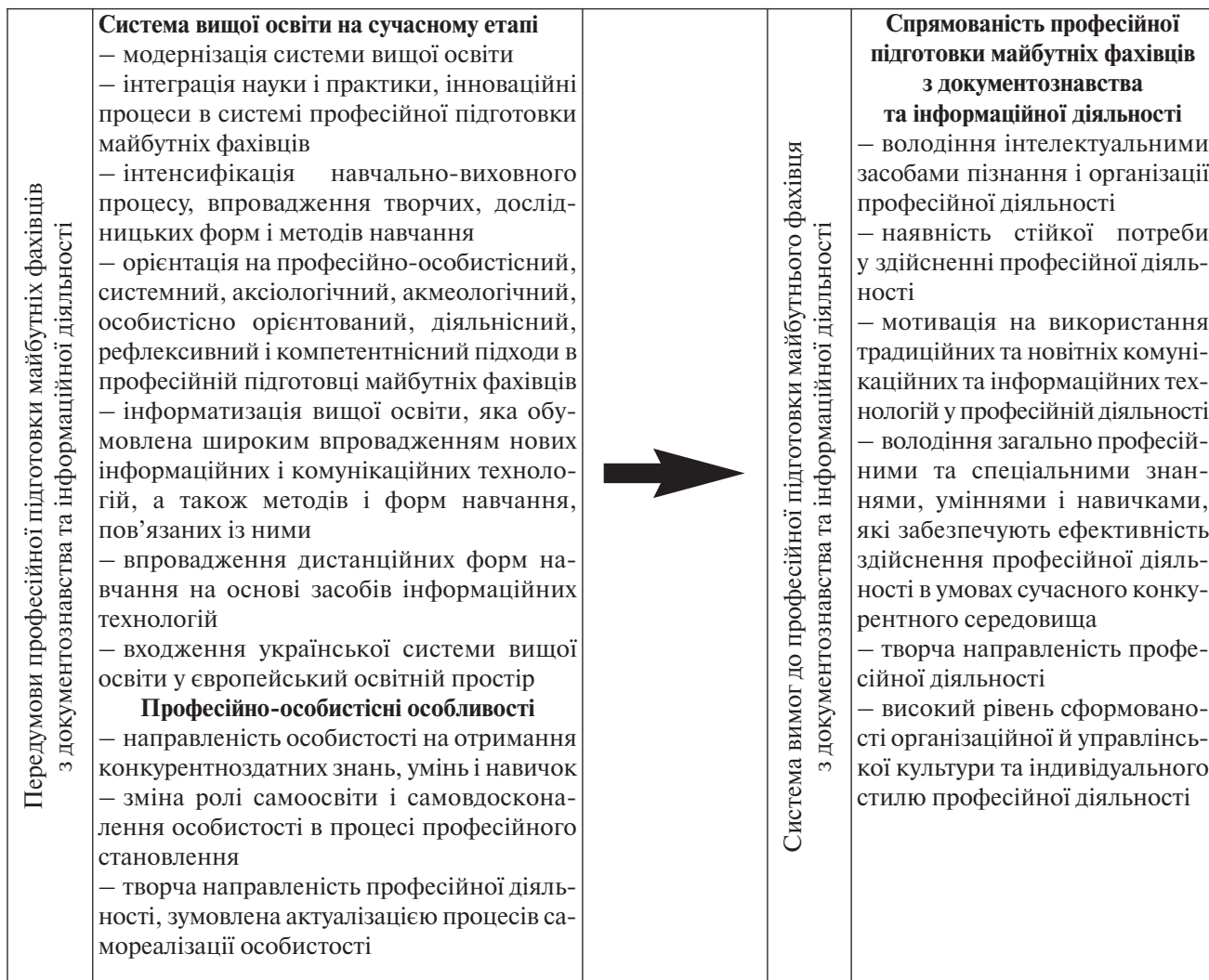
Рис. 1. Взаємовплив сучасних тенденцій функціонування вищої освіти на формування вимог до професійної підготовки майбутніх фахівців з документознавства та інформаційної діяльності

Гуманітаризація освіти актуалізує проблему вдосконалення організаційної та управлінської культури майбутніх фахівців на основі розробки особистісно орієнтованих технологій, забезпечує умови особистісного розвитку студента, його самореалізації у професійній діяльності, сприяє підвищенню розумового потенціалу, формування світогляду, духовних зразків поведінки.