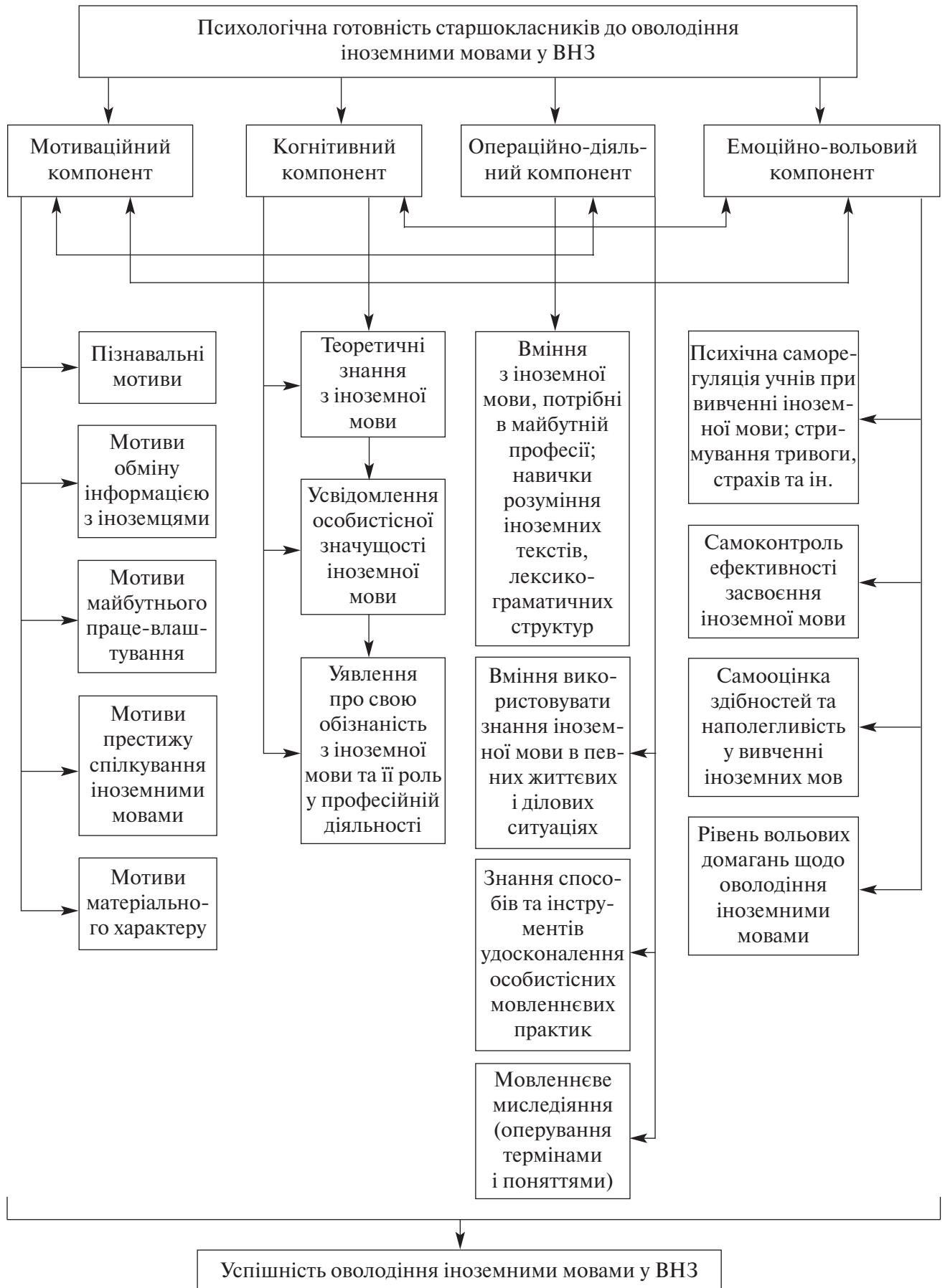
Рис. 1. Модель психологічної готовності старшокласників до оволодіння іноземними мовами у ВНЗ